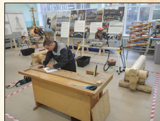
Реставрация памятников деревянного зодчества