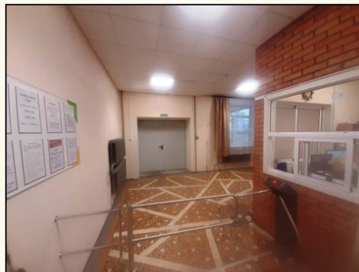
Общежитие Кутузова, 11