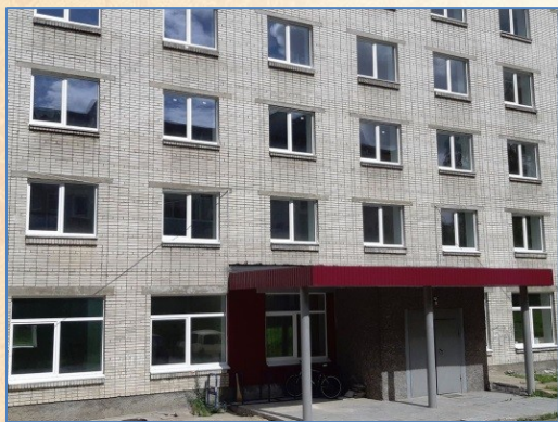
Общежитие Кутузова, 11