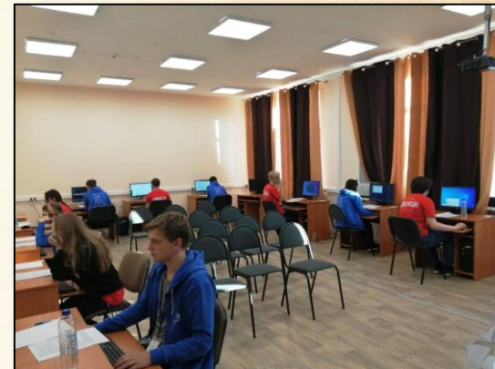
Программные решения для бизнеса