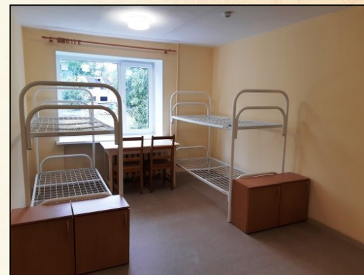
Общежитие Мурманская, 28