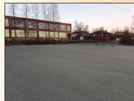
Мастерские и площадка, пр. Первомайский, д. 56